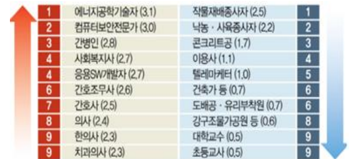
&lt;그림&gt; 연 평균 채용 증가율(2016, 한국고용정보원)